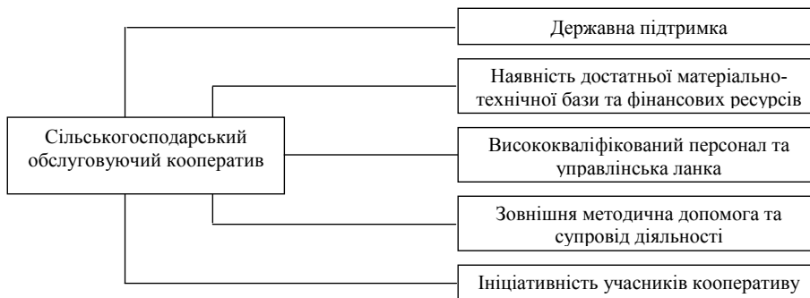
Рис. 3. Фактори, що сприяють розвитку сільськогосподарського обслуговуючого кооперативу

— сприяють розвитку сільськогосподарських товаровиробників;