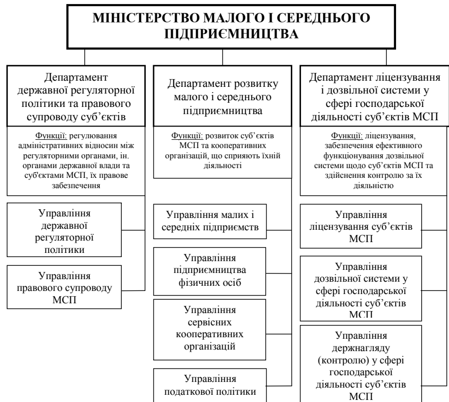
Рис. 3. Пропонована структура Міністерства малого і середнього підприємництва України

Коротко викладемо наше бачення щодо створення Міністерства малого і середнього підприємництва України. Враховуючи наявний досвід і значний кадровий потенціал Департаменту державної регуляторної політики та розвитку підприємництва Міністерства економічного розвитку і торгівлі України, а також Державної служби України з питань регуляторної політики та розвитку підприємництва (Держпідприємництво України), вбачаємо за доцільне реорганізацію названих інституцій