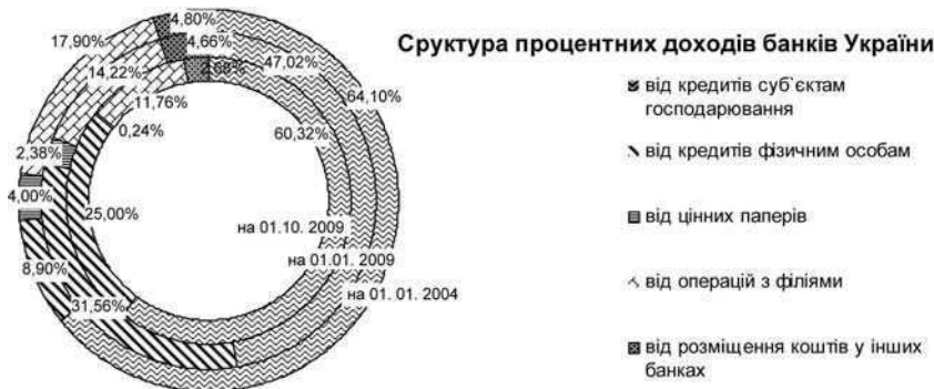
Рис. 1. Структура процентних доходів банків України