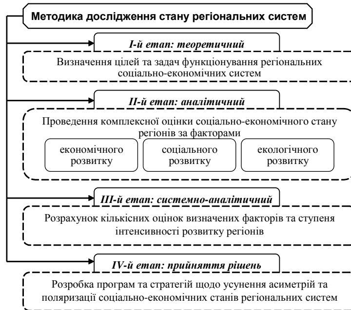
Рис. 2. Методика дослідження стану регіональних економічних систем

структурно-цілісне просторово-локалізоване утворення, яке базується на взаємодії підсистем природного, господарського, економічного та соціального характеру. Мета сумісного функціонування цих підсистем спрямована на вирішення стратегічних завдань: збільшення валового регіонального продукту і підвищення стандартів якості та тривалості життя населення за умов не погіршення екологічного стану системи національного господарства.