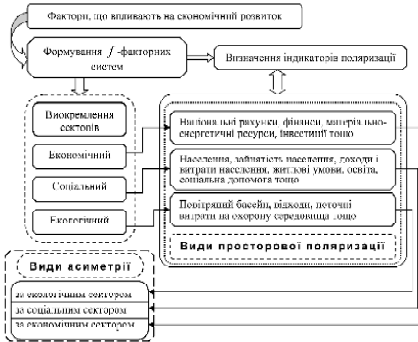
Рис. 3. Взаємозв'язок просторової поляризації та видів асиметрії

нальне відхилення (поліпшення або відставання) від норми збільшується за певний проміжок часу. Використання терміну асиметрія, на наш погляд, є більш прийнятний при використанні його до складних і комплексних утворень, тому в рамках наших досліджень пропонуємо виконувати оцінку асиметрії за відповідними секторами: економічному, соціальному і екологічному.